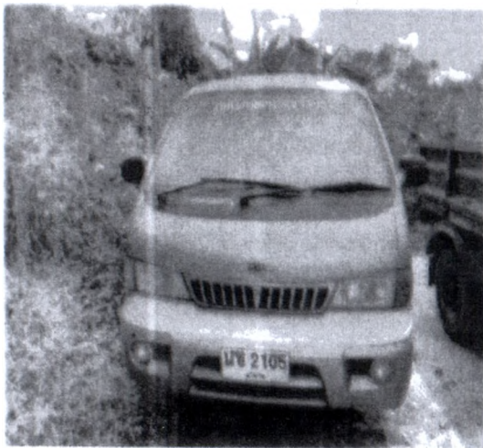
บัญชีแสดงการใช้รถยนต์ ของเทศบาลตำบลแจ้ห่ม รถยนต์ หมายเลขทะเบียน นข ๒๑๐๕ ลำปาง